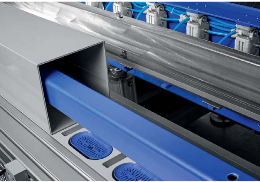
Detail der BM 306A, Biegung eines Rechteckkanals